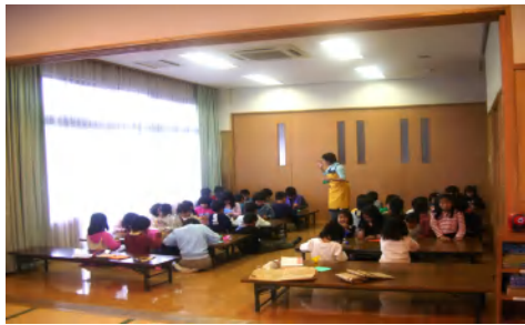
南風小学校放課後児童クラブの様子

夫婦共働きの家庭も増え、土曜日にも両親共に仕事等に出かけ子供たちだけで留守番をしている家庭も増えていきます。放課後児童クラブの土曜日開所は近隣の自治体ではすでに実施、もしくは平成19年度実施予定となっています。放課後児童クラブ土曜日開所の要望は非常に多く、一刻も早い対応が望まれています。前原市はいつから実施できるのか。との質問に対し、「前原市の入所児童保護者の勤務状況を調査すると両親共、土曜日に仕事をしている家庭が約40%である。このような状況を踏まえ、土曜日を開所すべきだと考えている」との回答を得ました。