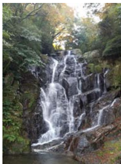
糸島市の名勝 白糸の滝

白糸の滝「ふれあいの里」復活イベントとして「やまめ釣り祭り」や、「滝周辺ウォーキング」他も検討していきたい。