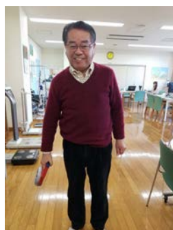
フレイルチェックで 握力を測定中

→フレイル予防事業のさらなる発展のため、厚生労働省をはじめとする関係省庁へ積極的に働きかけを行いたい。