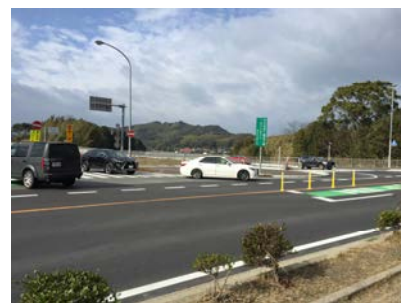
往来が激しい 前原インターチェンジ 出入口付近と新バイパス が接する地点