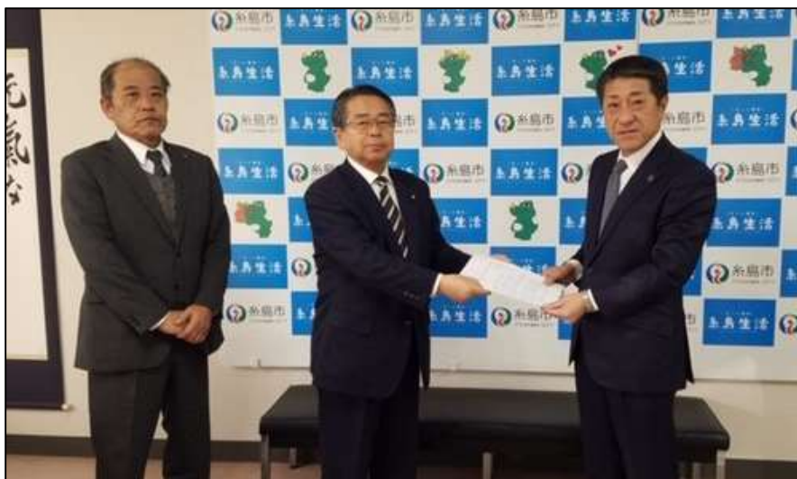
月形市長に202号線バイパス安全対策の 要望書を手渡す（左から並里議員、笹栗、月形市長）