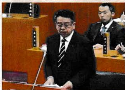
令和元年12月議会質問の様子